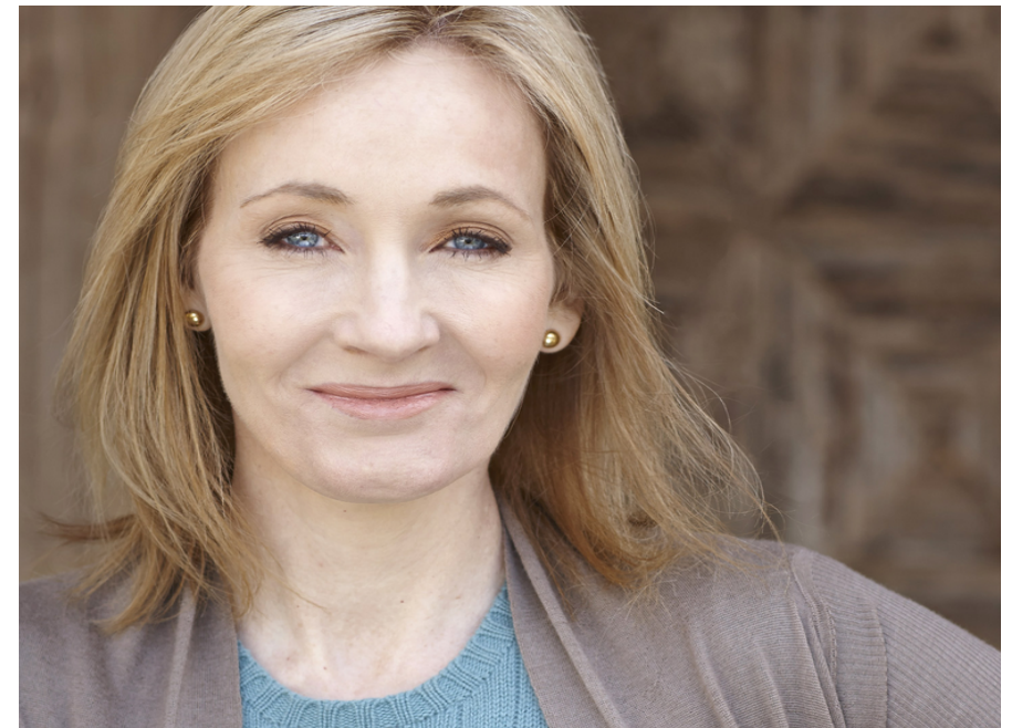
Joanne Rowling, Yate, 31 luglio 1965 è una scrittrice britannica.