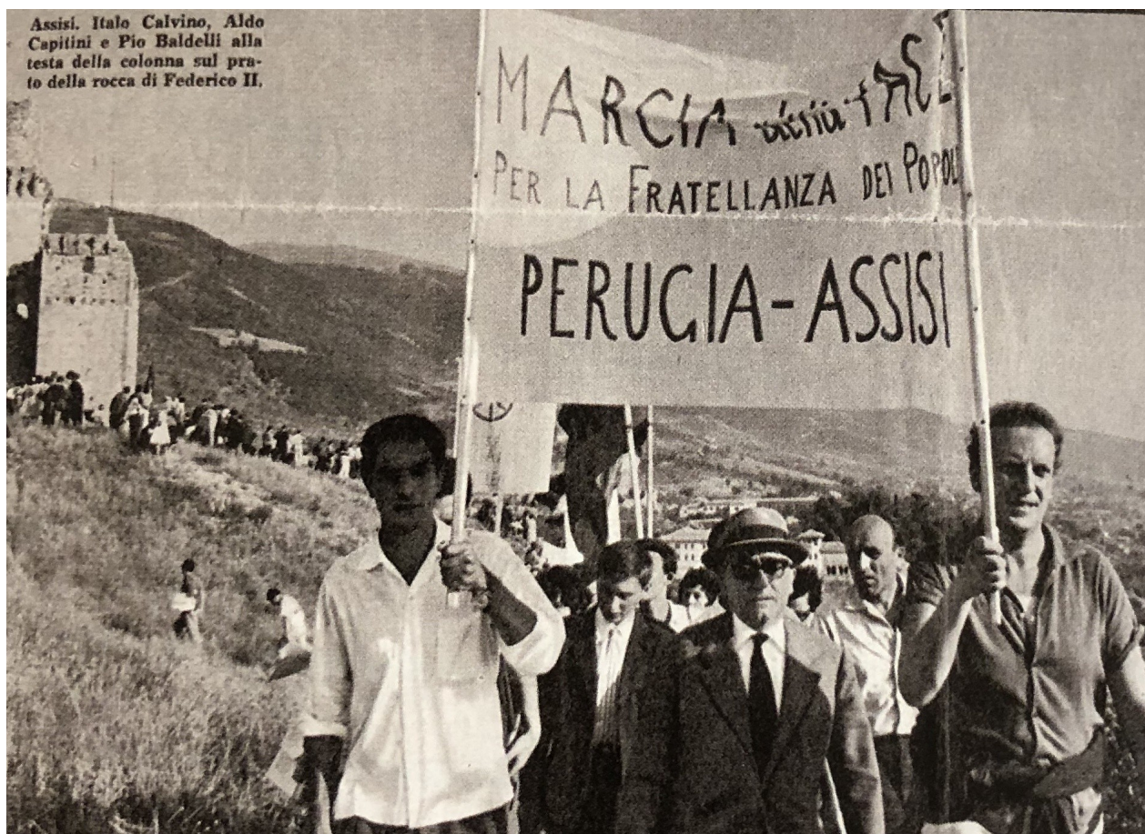
Assisi. Italo Calvino, Aldo Capitini e Pio Baldelli alla testa della colonna sul prato della rocca di Federico II.

Aldo Capitini con lungimiranza ci educava e ci educa alla nonviolenza come metodo e oggetto di un serio progetto politico.